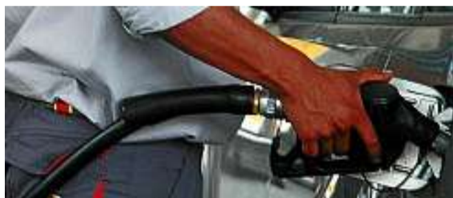
Distributore di benzina. A Verona è lotta tra due sindacati di gestori

Il primo, che non aderisce alla federazione nazionale, accusa l'altro di non rappresentare la categoria